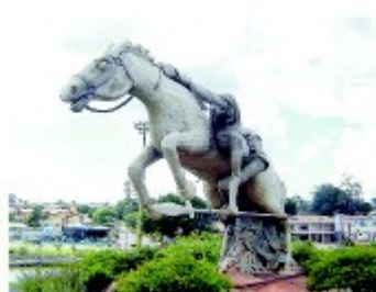
A comenda Guaicurus de Economia será entregue pela quarta vez