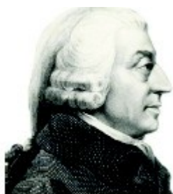
Adam Smith foi o Teórico mais influente da Economia

As indicações podem ser feitas até o dia 30 de abril de 2011. Contamos com a sua colaboração.